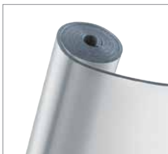
Disponibile in Versione Curve e T accoppiate. Dima standard